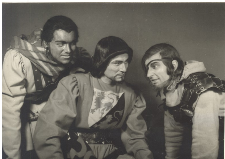
Lope de Vega, Fuenteovejuna . Teatro Dramático Yugoslavo, Belgrado, 1951

Calderón ha sido el primero, y Lope el más presente en los escenarios de Serbia y Yugoslavia, probablemente por su espíritu popular y su estilo. Empieza a traducirse en los años 50 del siglo XX y en ello han influido los factores ideológicos más que los culturales o literarios. Las interpretaciones del momento veían en Fuenteovejuna una obra democrática en la que se confrontaban pueblo y autoridad. La crítica soviética, bastante presente en Yugoslavia por estos años de la posguerra, insistía en la imagen de un Lope anti-monárquico 17 . Es la primera obra del Fénix traducida del castellano y estrenada en Yugoslavia (1950).