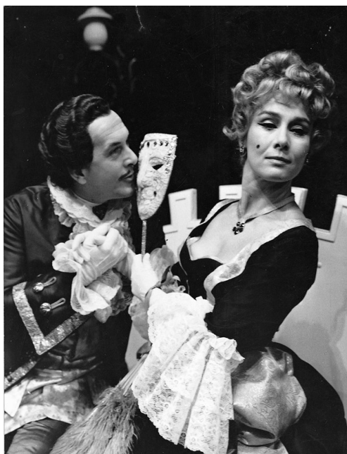
Lope de Vega, La dama boba . Teatro Dramático Yugoslavo, Belgrado, 1968

Se han representado de Lope también La dama boba , La discreta enamorada y El arrogante español o Caballero de milagro , en la capital pero también en teatros de varias ciudades provinciales (Zrenjanin, Pirot, Kragujevac, Niš, Užice, Kruševac, etc.). Estos montajes difieren por su calidad y éxito, aunque, gracias a los consabidos valores —“la calurosa sangre española, el amor, la pasión y los celos”—, han sabido agradar al público.