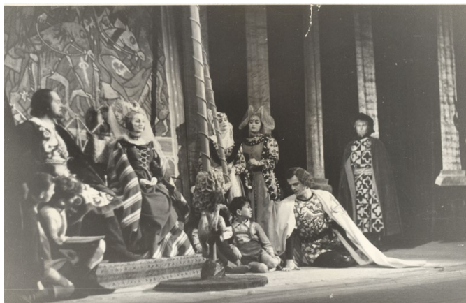
Lope de Vega, Fuenteovejuna . Teatro Dramático Yugoslavo, Belgrado, 1951

Se han representado de Lope también La dama boba , La discreta enamorada y El arrogante español o Caballero de milagro , en la capital pero también en teatros de varias ciudades provinciales (Zrenjanin, Pirot, Kragujevac, Niš, Užice, Kruševac, etc.). Estos montajes difieren por su calidad y éxito, aunque, gracias a los consabidos valores —“la calurosa sangre española, el amor, la pasión y los celos”—, han sabido agradar al público.