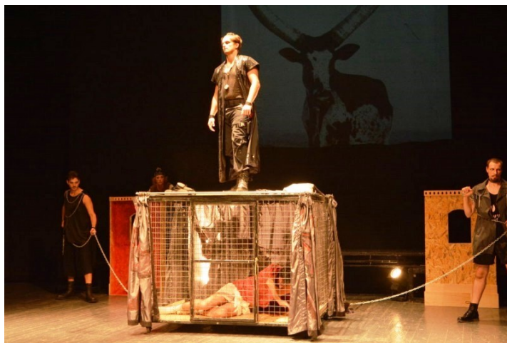
Calderón, La vida es sueño . Teatro de Šabac, 2016

La segunda pieza del mismo dramaturgo es La dama duende , estrenada en el Teatro Nacional de Belgrado en 1932. Esta comedia de capa y espada fue traducida para ser llevada a escena y nunca se publicó. Su traductor es Iso Velikanović (1868-1940). Los críticos y el público vieron en ella “la esencia de lo español, en los sentimientos de honor, de la religión y del amor” 15 , mientras que otro crítico apuntaba que la pieza le recordaba “una riquísima capa femenina sacada del armario” 16 .