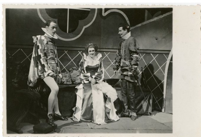
Calderón, La dama duende , 1932. Teatro Nacional de Belgrado.

La segunda pieza del mismo dramaturgo es La dama duende , estrenada en el Teatro Nacional de Belgrado en 1932. Esta comedia de capa y espada fue traducida para ser llevada a escena y nunca se publicó. Su traductor es Iso Velikanović (1868-1940). Los críticos y el público vieron en ella “la esencia de lo español, en los sentimientos de honor, de la religión y del amor” 15 , mientras que otro crítico apuntaba que la pieza le recordaba “una riquísima capa femenina sacada del armario” 16 .