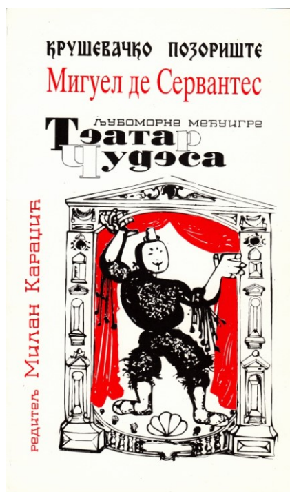
Cervantes, Teatro de las maravillas . Teatro de Kruševac, 1995.