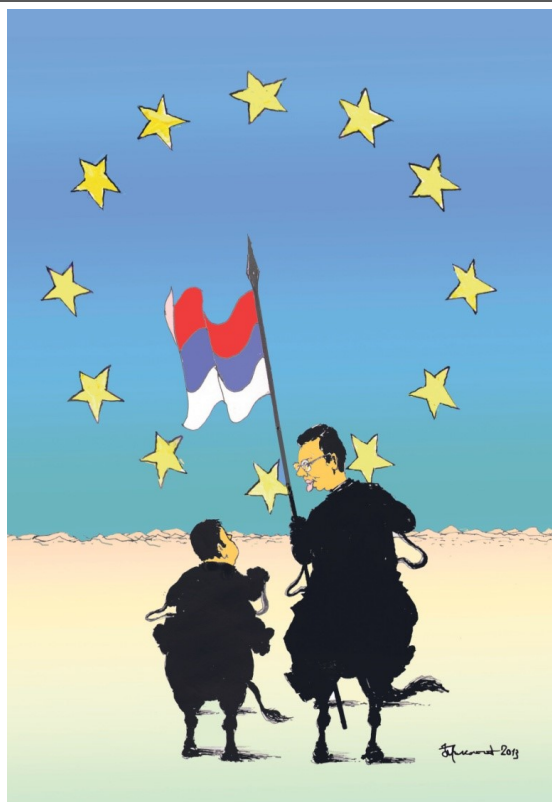
Los políticos serbios ante la UE. Kurir, 2014

De los demás autores barrocos, se llevan la palma los dramaturgos. Calderón es el primero en ser representado. No se ha traducido mucho —por ser tan difícil—, pero La vida es sueño se sigue representando desde el siglo XIX hasta la actualidad en intervalos más o menos regulares (1874, 1875, 1899, 1964, 1987, 1994, 2012...). Un crítico agradecía al director del montaje de 1964 por “avivar el interés por esta obra realmente grande pero /.../ insuficientemente conocida” 13 por nosotros 14 , subrayando el carácter universal del lema calderoniano. El último estreno data de 2016, en el Teatro de Šabac, donde el director Lukač se ha propuesto interpretar el texto calderoniano como una crítica burlesca de la política y de las clases dirigentes.